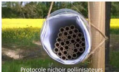
Protocole nichoir pollinisateurs

critères, en fonction de la surface étudiée : bande fleurie, haie, couvert d'interculture, parcelle en agroforesterie mais aussi en fonction de leur complémentarité en termes de durée et de mode de piégeage.