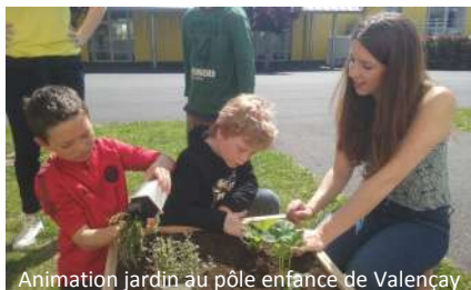
Animation jardin au pôle enfance de Valençay

Créer un jardin pédagogique avec les enfants, c'est ce que nous faisons actuellement avec le Pôle Enfance de Valençay : découverte des étapes de la germination, plantation de radis, carottes, salades, fraisiers, tomates, plantes aromatiques, découverte des amis et ennemis du potager, construction d'un