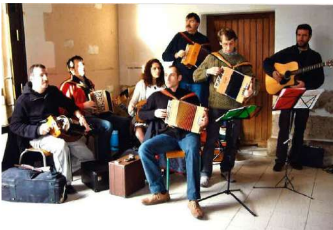
Les copains de Caméléon Production lors du marché de Noël de 2008

C'était il y a 10 ans, en 2008 donc, le samedi 20 décembre, le Marché de Noël réunissait déjà sous la Halle la crème de nos productions locales.