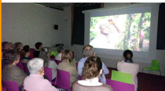
Projection du film « Ceux qui sèment » le 10 novembre 2017 à la médiathèque de Valençay à l'occasion du festival AlimenTerre