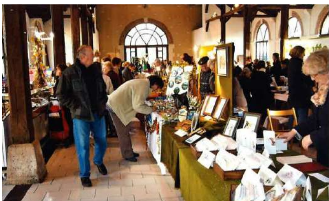
Les visiteurs déambulant dans les allées du marché