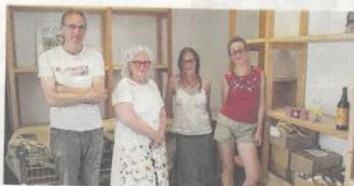
La boutique est prête pour accueillir les produits locaux. Elle ouvre le 24 juin.