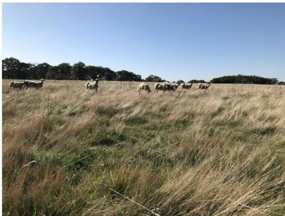
Les prairies pâturées ne sont entretenues que par la présence des moutons. Au 10 octobre 2023, elles sont desséchées comme en été, en raison d'un climat plus chaud que la normale.

Pour Tony Massé, « La chaleur a forcément un impact. Une prairie a sa réactivité. Il faut aussi que les animaux fassent une part d'effort face à cela, qu'ils puisent dans leur stock de gras et de muscles. Face au changement climatique, une sélection s'opère avec ceux qui s'en sortent le mieux ».