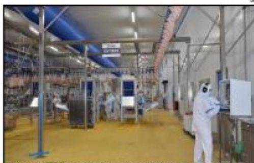
Le nouvel abattoir d'Ancois aura coûté 43 millions d'euros.

Les producteurs ont été accompagnés, des négociations ont été menées avec les différentes enseignes pour revaloriser les prix, et la cellule de spécialistes de la coop, qui agit sur les marchés de l'énergie, a limité les frais.