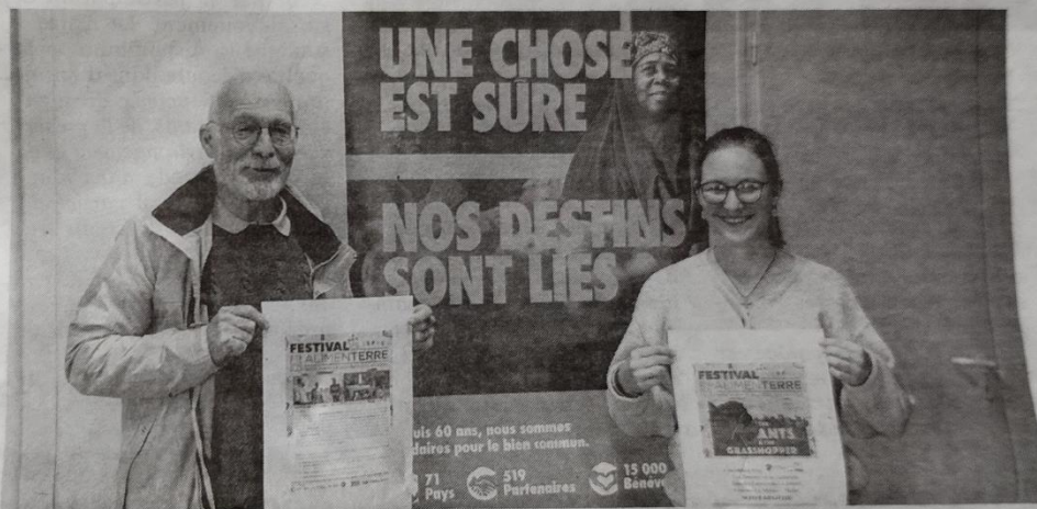
Le groupe local CCFD Terre solidaire et le Civam Seuil du Poitou proposent un ciné débat autour de la production alimentaire agricole.

« Nous avons voulu programmer un film qui parle des pays du Sud, pour qu'il corresponde aux actions du CCFD. L'organisation finance des projets portés localement. On ne fait pas à la place des gens, on les accompagne dans des initiatives qui correspondent aux idées que nous