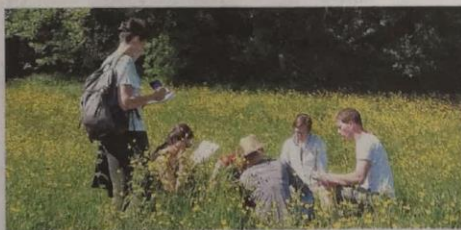
La diversité floristique caractérise les prairies naturelles.

L e réseau Civam Poitou-Charentes et la LPO organisent le concours « Pratiques agroécologiques prairies et parcours » (compétition intégrée au programme du Concours général agricole) dans le sud-est Vienne les 12 et 13 juin prochains. Il vise à mettre en avant les pratiques des éleveurs du secteur qui valorisent des prairies naturelles. « Le Montmorillonnais englobe plusieurs sites Natura 2000 qui offrent un maillage de milieux naturels et une trame bocagère propices à une biodiversité riche et diversifiée, d'intérêt européen. Sur ce même territoire, depuis plus de deux ans, des éleveurs ovins et bovins s'intéressent justement