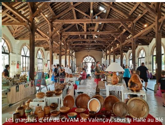
Les marchés d'été du CIVAM de Valençay, sous la Halle au Blé