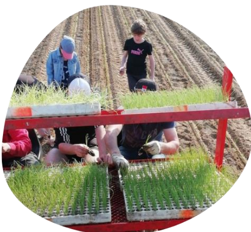
Plantation des oignons

Irrigation de mai à août Traitements agréés par cahier des charges de l'Agriculture Biologique