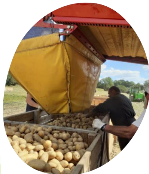
Récolte des pommes de terre