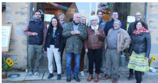
Photo prise le 5 octobre 2024 à l'occasion des 40 ans de l'Adar